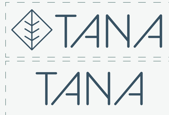
Soporte rectangular - Eje horizontal