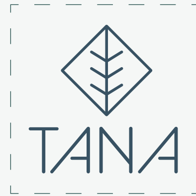
Soporte cuadrado - Eje vertical